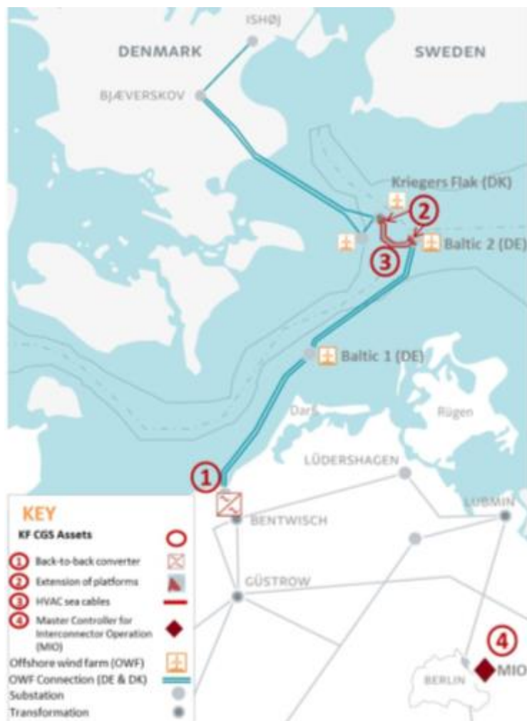
Figur 1: Kort over KF-projektområdet og systemets hovedelementer