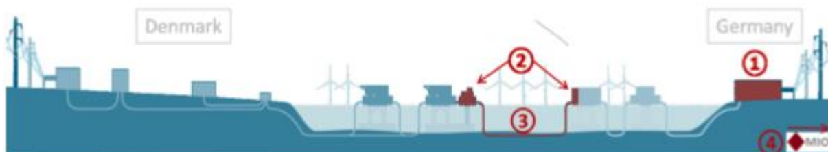
Figur 2: KF CGS-aktiver