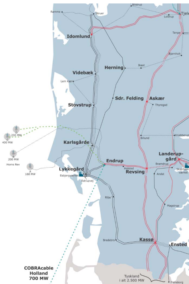
Figur 3 Netstruktur 2035 – to kabler og eksisterende 150 kV-luftledning.

Løsningen er ikke tilstrækkelig til at kunne indpasse Viking Link og Vestkystforbindelsen, og løsningen kan ikke indpasse yderligere vedvarende energi end forudsat i Analyseforudsætninger 2015.