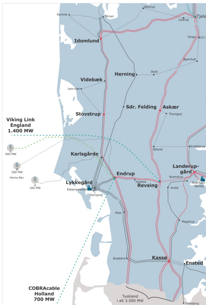
Figur 2 Indstillet løsning, 400/150 kV-kombiledning mellem Endrup og Idomlund studie 2035.

Med denne løsning er det muligt at holde de store energitransporter på 400 kV-niveau og i større udstrækning end tidligere anvende 150 kV-transmissions-nettet til forsyning af forbrug og til at sikre de lokale producenters adgang til markedet.