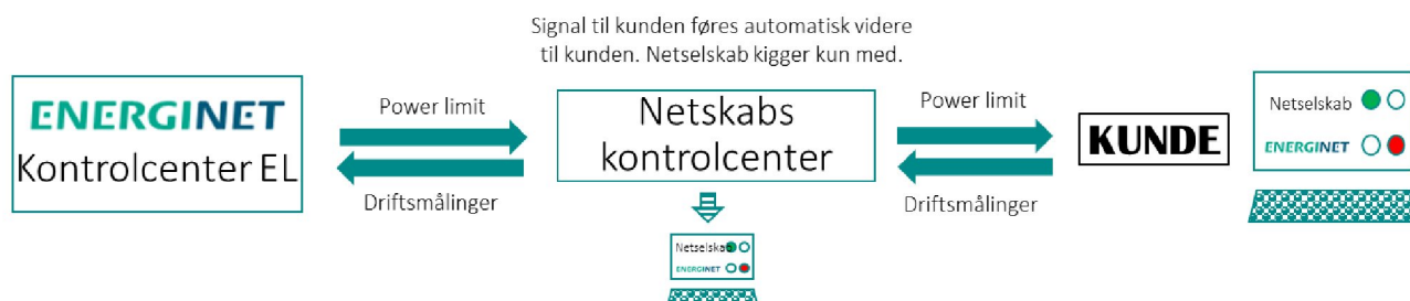
Figur 2 Illustration af mulig driftsmæssig håndtering

Energinets anvendelse af afbrydeligheden i driften, dvs. udmelding af konkrete begrænsninger af systembrugernes forbrug, kan først foretages, når der er foretaget en teknisk, driftsmæssig implementering. Den praktiske udformning og implementering af det driftsmæssige samarbejde imellem Energinet og netvirksomhederne skal derfor være gennemført, inden det er muligt at lade denne metode træde i kraft.